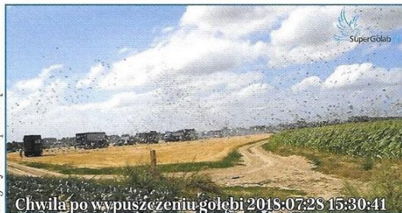
Chwila po wypuszczeniu gołębi 2018:07:28 15:30:41

Dwa nieba. Taka była różnica na miejscu startu do Lotu Narodowego Bruksela'2018. Pogoda wystawiła nerwy osób decydujących o starcie i oczekujących na ten moment na nie lada próbę. Rano przechodził przez Brukselę front atmosferyczny z burzą i ulewą. Front powoli przesunął się w stronę Polski, hamowany przez sunącą się przed nim masę gorącego powietrza. Trzeba było odczekać, aż front oddali się na tyle, aby gołębie nie dogoniły go. Analiza meteorologiczna wskazywała, że po południu będą dobre warunki i rzeczywiście tak było.