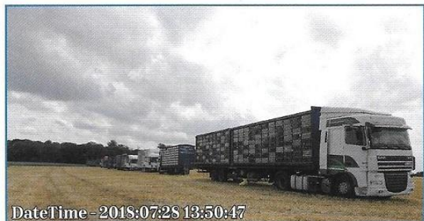
DateTime - 2018:07:28 13:50:47